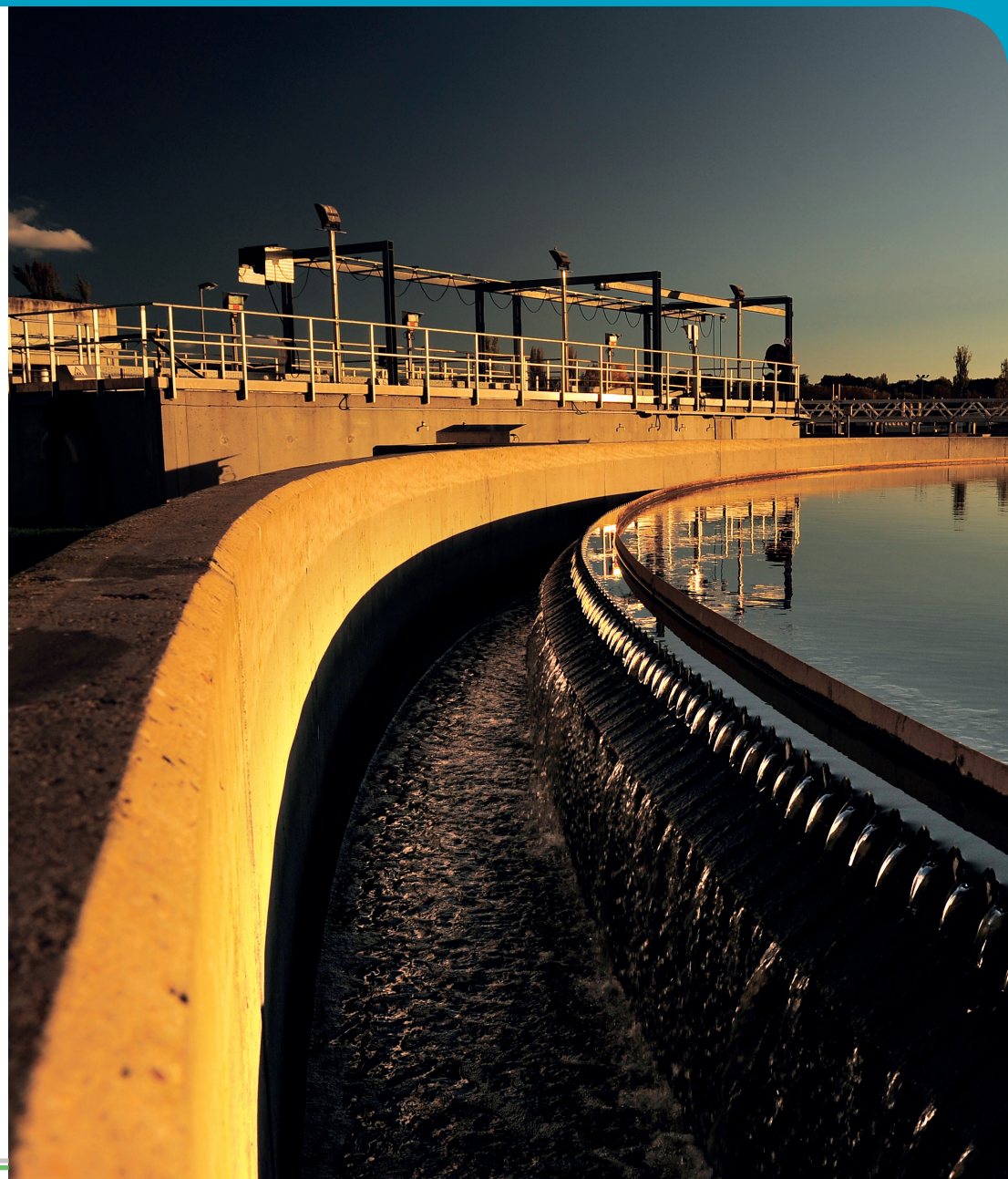
Photo couverture : Station d'épuration de Tours • Réalisation : Elodie Fourmont - Octobre 2019

Et si nos eaux usées devenaient du gaz vert ?