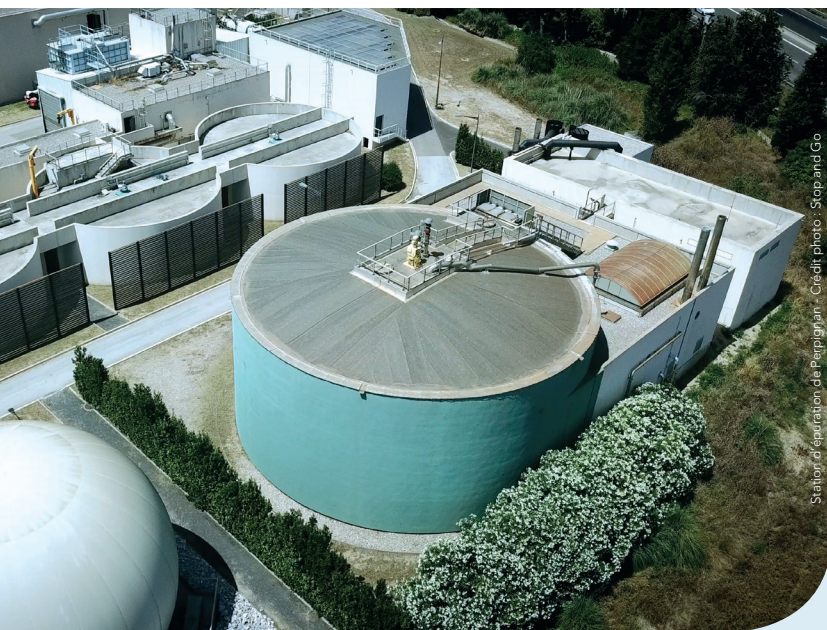
Station d'épuration de Perpignan

C'est pourquoi de plus en plus d'élus et de collectivités misent sur la station d'épuration de demain, véritable outil de développement durable des territoires au-delà de sa capacité à préserver nos milieux aquatiques. Une centaine de collectivités se sont déjà lancées, pourquoi pas vous ?