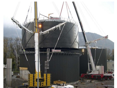
Pose de la cloche de stockage de biogaz sur le digesteur.

Une vidéo sur le projet : https://www.youtube.com/watch?v=QJNEyIPtigg Le site du Groupe de Travail Injection : http://injectionbiomethane.fr